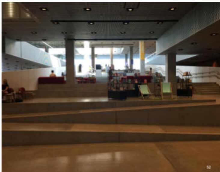
Slide 52, presentazione del Prof. D'Alonzo

promuovere l'inclusione, promuovere l'accessibilità, a mio parere, significa generare libertà e umanità per tutti.